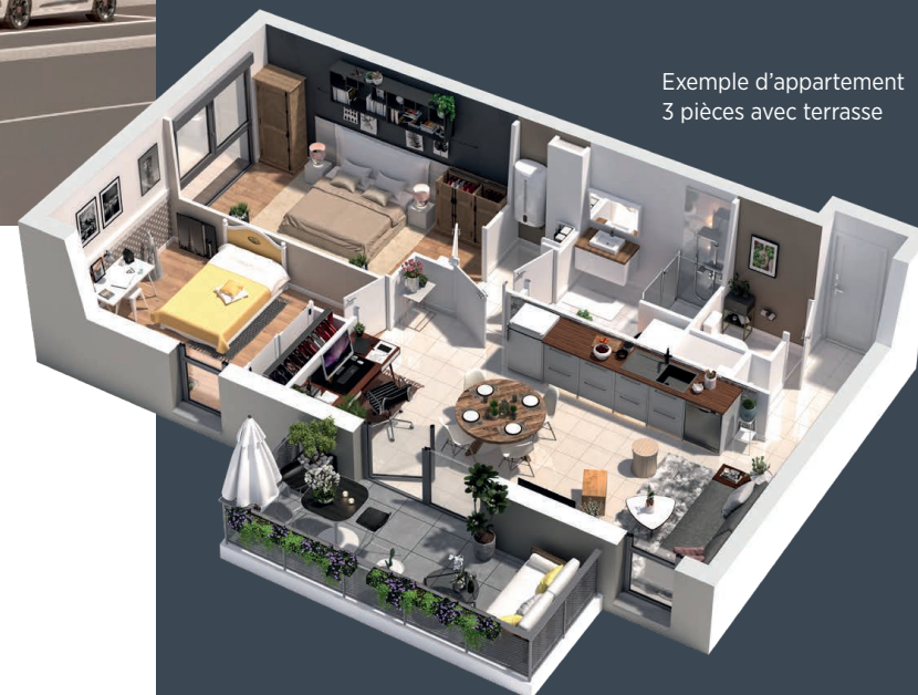
Exemple d'appartement 3 pièces avec terrasse